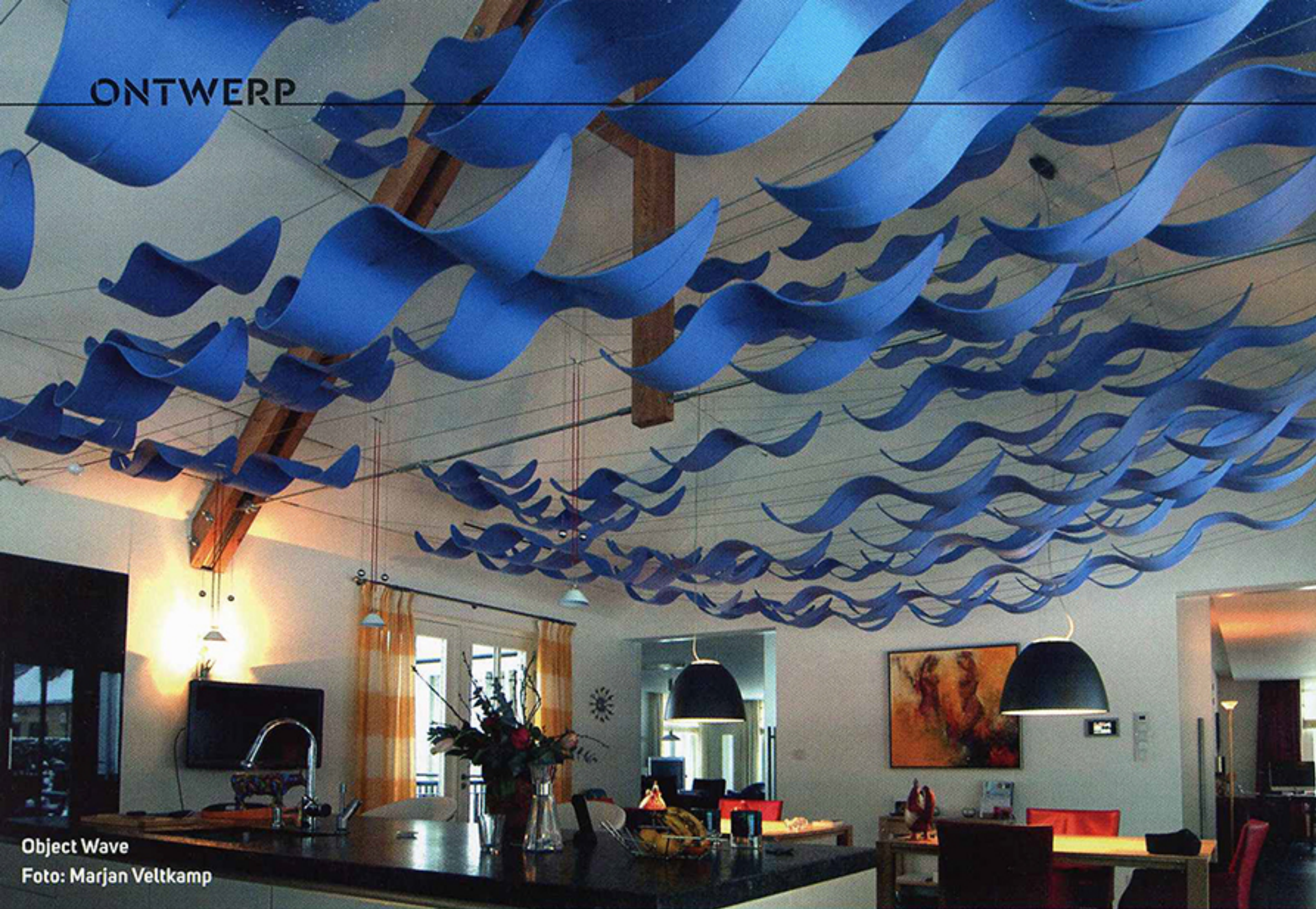
Object Wave